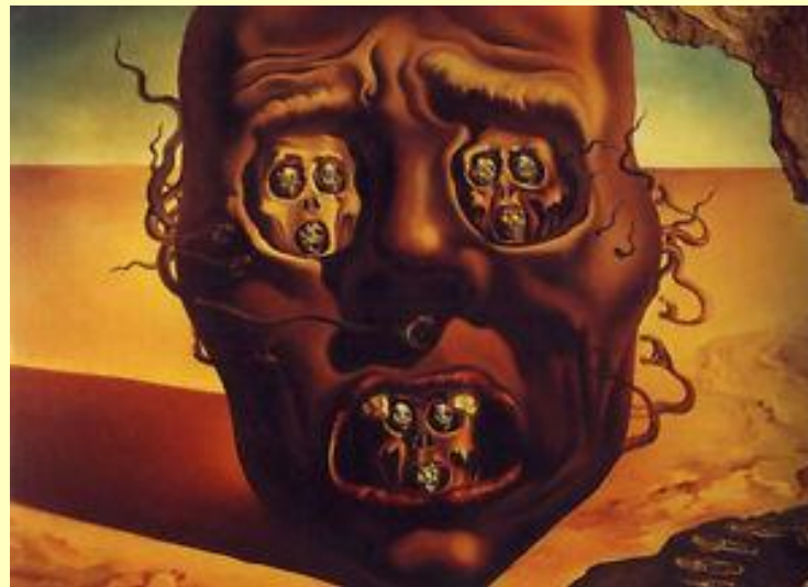
Salvador Dalí, Volto della guerra , olio su tela, 1940, Rotterdam, Museum Bijmans Van Beuningen