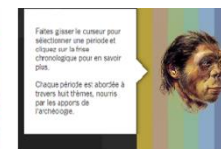
OUTILS (frises, cartes, lexique)