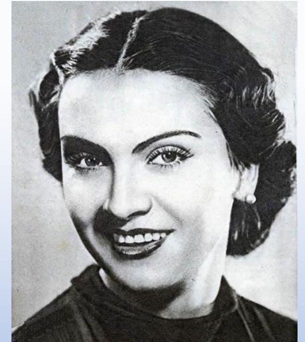
Maria Tănase (1913-1963)

Ils m'ont également demandé qui était mon chanteur préféré. J'ai montré aux enfants, sur leur tableau interactif, ma chanteuse préférée; Maria Tănase, et je leur ai dit brièvement qu'elle est la plus grande chanteuse roumaine de tous les temps et qu'elle était appelée la „ Edith Piaf de Bucarest ”. Bien sûr, je leur ai aussi montré d'autres choses intéressantes liées à la culture roumaine et française.