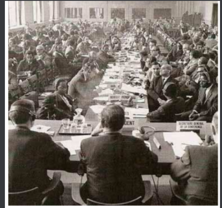
DOCUMENT 1 : EXTRAITS DU COMMUNIQUÉ FINAL DE LA CONFÉRENCE DE BANDOUNG (24 AVRIL 1955)