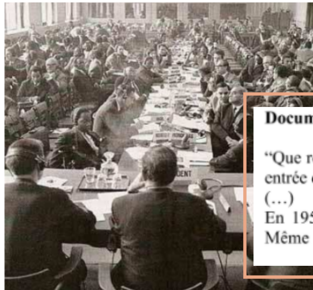
Document 2 : La création de la CNUCED